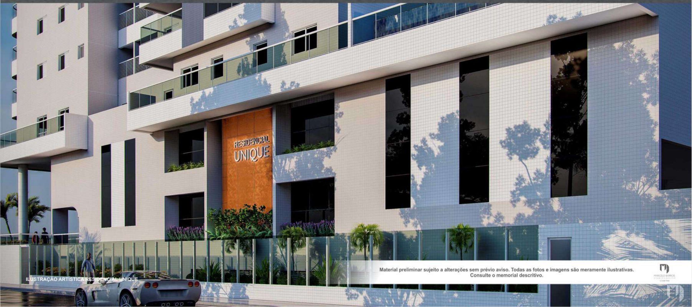
ILUSTRAÇÃO ARTÍSTICA RESIDENCIAL UNIQUE

Material preliminar sujeito a alterações sem prévio aviso. Todas as fotos e imagens são meramente ilustrativas. Consulte o memorial descritivo.